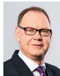
AART DE GEUS Vorstandsvorsitzender Bertelsmann Stiftung

Sowohl die Bertelsmann Stiftung als auch der SDSN haben sich dem weltumspannenden Erfolg der nachhaltigen Entwicklungsziele verpflichtet. Wir werden diesen Bericht, der Ländern helfen soll, die Umsetzung in Gang zu bringen, auch in den nächsten drei Jahren gemeinsam erstellen. Wir freuen uns schon jetzt über die Möglichkeit, die Qualität und die Datenbasis des Index und der Dashboards künftig weiter zu verbessern. Dies ist unser „erster Aufschlag“, deshalb sind uns jegliches Feedback zu den Stärken und Schwächen des Index und der Dashboards für die nachhaltigen Entwicklungsziele und jede Ihrer Anregungen, wie wir ihn noch praxistauglicher und informativer machen können, sehr willkommen.