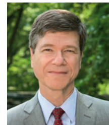
JEFFREY D. SACHS Direktor, Sustainable Development Solutions Network