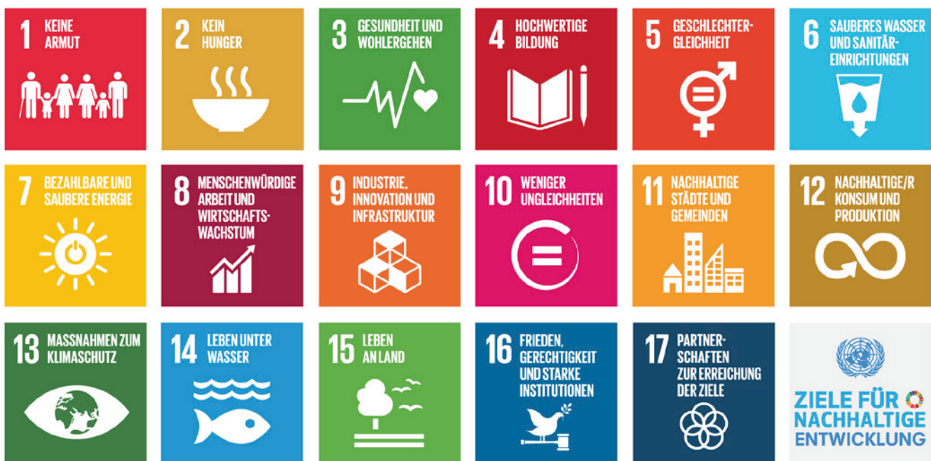
Abbildung 1. Die Sustainable Development Goals (SDGs)

Die Statistische Kommission der Vereinten Nationen hat ein Verfahren zur Entwicklung eines globalen Indikatoren-Rahmens für die 17 SDGs und 169 Unterziele in Gang gesetzt. Die Kommission stimmte einem vorläufigen Satz von 231 Indikatoren (UN 2016) zu, die auf der Arbeit der Inter-Agency and Expert Group on SDG Indicators (IAEG-SDGs) basieren. Die IAEG-SDGs unterteilte diese Indikatoren anschließend in drei Gruppen (IAEG-SDGs 2016, Stand März 2016): Gruppe I umfasst 98 Indikatoren (40%) mit anerkannten statistischen Methoden und regelmäßig verfügbaren weltweiten Daten; 50 Indikatoren (21%) bilden Gruppe II mit klaren statistischen Methoden, aber wenig verfügbaren Daten; und 78 Indikatoren (32%) fallen