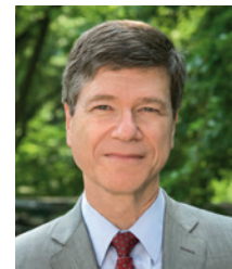
JEFFREY D. SACHS Direktor, Sustainable Development Solutions Network